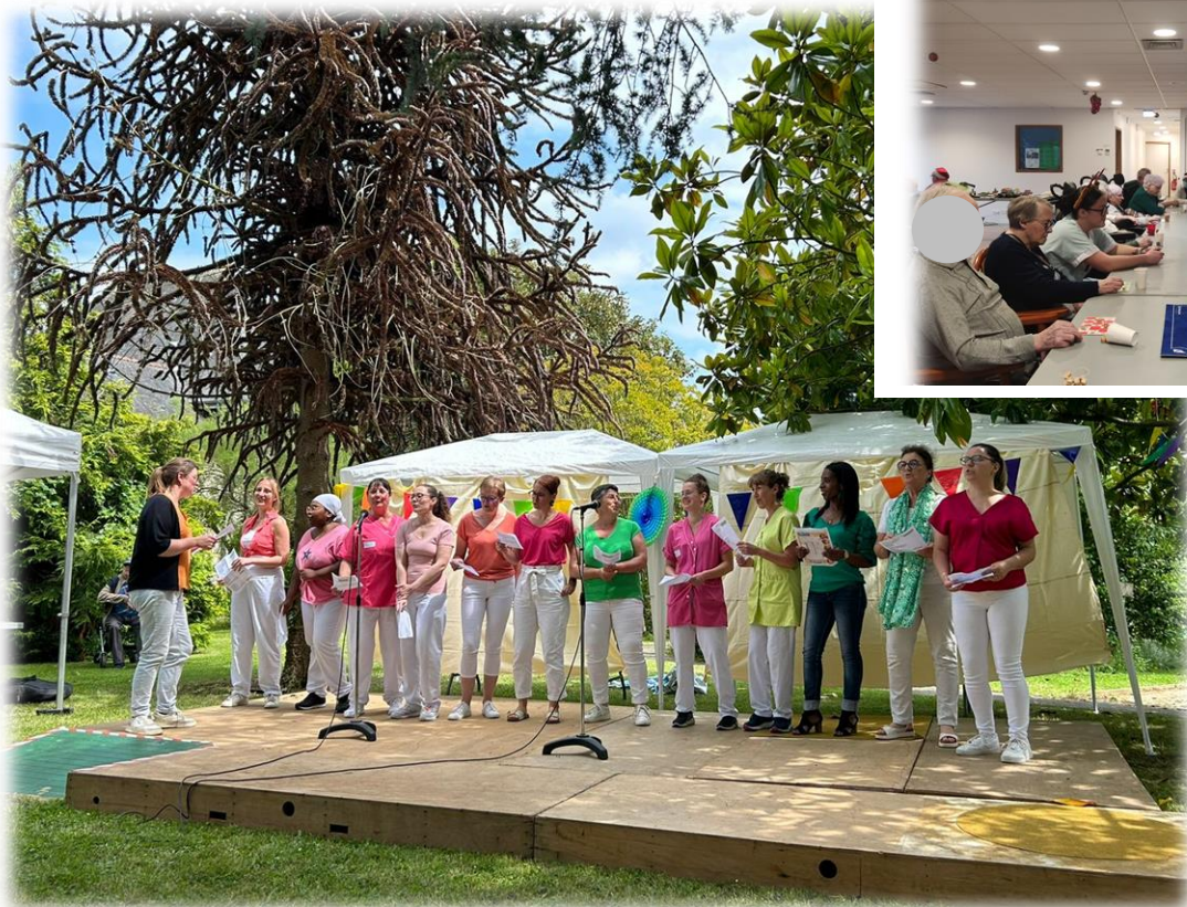
Fête de la musique dans le parc